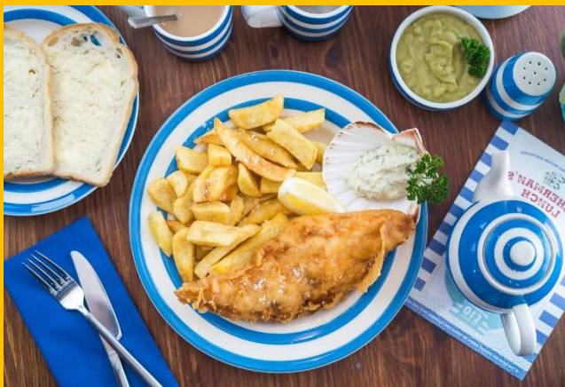
フィッシュ&チップス