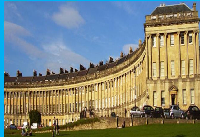
ロイヤルクレッセント